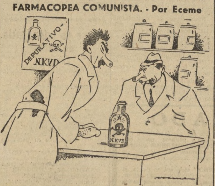
—Nada de penicilina, lo mejor es nuestro depurativo N. K. V. D. cuyos resultados tan patentes son en Bulgaria, Rumania, etc. etc.

Lo mismo en Grecia que en todos los países balcánicos, la gente está obsesionada por el temor al comunismo, e instintivamente, miran a la derecha, aun que no se atreven a exteriorizar su sentir. — EFE.