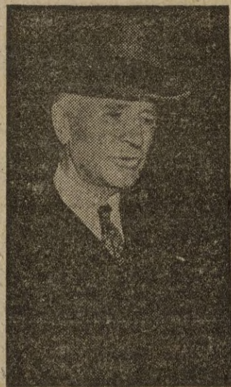
Oslo 12.—Al ex secretario de Estado norteamericano, Cordell Hull le ha sido adjudicado el premio Nobel de la Paz correspondiente a 1945 anuncia la agencia de noticias noruega.—EFE.