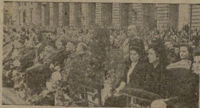
La Excm. señora doña Carmen Polo de Franco acompañada del Nuncio de S. S. y otros preladados asiste al acto de clausura del primer Centenario del Apostolado de la Oración, en la Plaza de la Armería de Madrid.