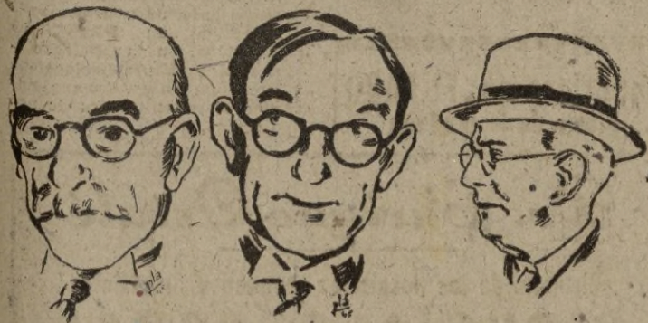
M. de Vabres, juez que representa a Francia.