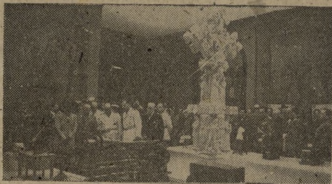
El Caudillo visitando la Exposición Nacional de las Escuelas de Artes y Oficios de España se detiene ante algunas elaboraciones artesanas de maquinaria y forja en la sala que preside el magnífico crucero en mármol de la Escuela de Valencia.