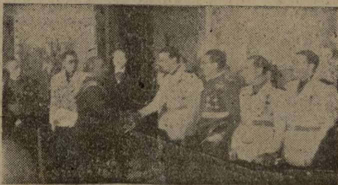
Con motivo de la fiesta del Caudillo S. E. el Jefe del Estado recibió a las primeras autoridades nacionales, al Cuerpo Diplomático y otras personalidades en brillante recepción que se verificó en el Palacio de El Pardo.