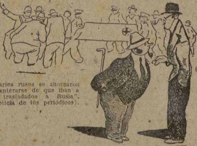
"Varios rusos se ahorcaron al enterarse de que iban a ser trasladados a Rusia". (Noticia de los periódicos).

--Bueno ¿pero porque se han ahorcado? -- Hombre, de alegría.