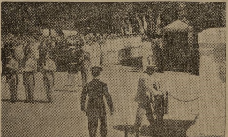
La guarnición de Washington, en el día de la Victoria es la primera del mundo que rinde homenaje a los caídos en la guerra. En el cementerio nacional de Arlington, ante la tumba del Soldado Desconocido, se colocó una corona y desfilaron las tropas, pocas horas después de conocida la rendición japonesa.