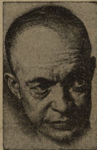
Roma, 13. — Eisenhower ha llegado a Roma y ha sido recibido en audiencia privada por el Papa. Le acompañaba el general Clark. — EFE.