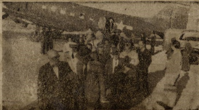
Los comisionados del Congreso Parlamentario de los Estados Unidos acompañados del embajador de aquel país en España, señor Norman Armour, abandonan el aeropuerto de Barajas.