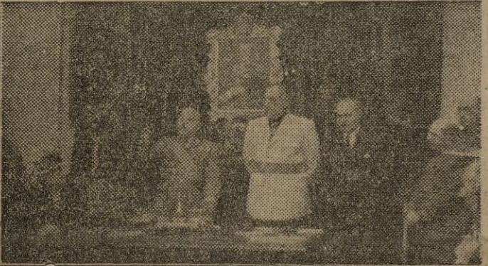
Se entrega al Caudillo el título de Diputado Honorario de la Excelentísima Diputación de Vitoria