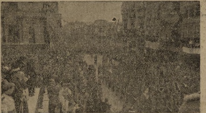
Desfile de la guarnición de Vitoria ante la presencia de S. E. el Jefe del Estado, durante la celebración de los actos a Fray Francisco de Vitoria