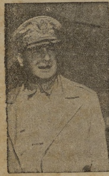
Tokio, 27.—La histórica entrevista entre Hiro Hito y Mac Arthur se celebró en la Embajada de los Estados Unidos.

Hiro Hito, acompañado de sus ayudantes, llegó a la Embajada esta mañana y fué inmediatamente introducido en el salón donde le esperaba de pie el comandante jefe aliado en el Japón.