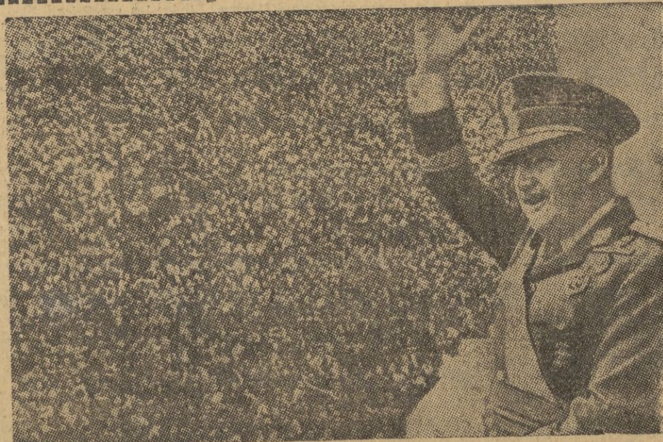
S. E. el Jefe del Estado saluda desde el Palacio Nacional a la inmensa multitud que le acclama en la Plaza de Oriente. Flamean los pañuelos blancos símbolo de paz y de triunfo jubiloso al grito: ¡Franco! ¡Franco! ¡Franco! —S. O. G.