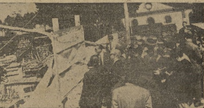
EL FERROCARRIL ZAMORA-LA CORUÑA. — Continúan con toda actividad las obras del ferrocarril Zamora-La Coruña. El señor Fernández Ladreda, ministro de Obras Públicas ha efectuado una visita a dichas obras y examina atentamente los planos del Viaducto que se construye sobre el río Miño para dicho ferrocarril.