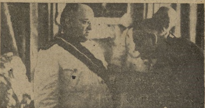
LA GRAN CRUZ DEL MERITO CIVIL PARA EL ALMIRANTE BASTARRECHE. — Cartagena. — El alcalde de Murcia ha impuesto en nombre de todos los Ayuntamientos mancomunados la Gran Cruz del Mérito Civil al almirante Bastarreche, capitán general del Departamento.