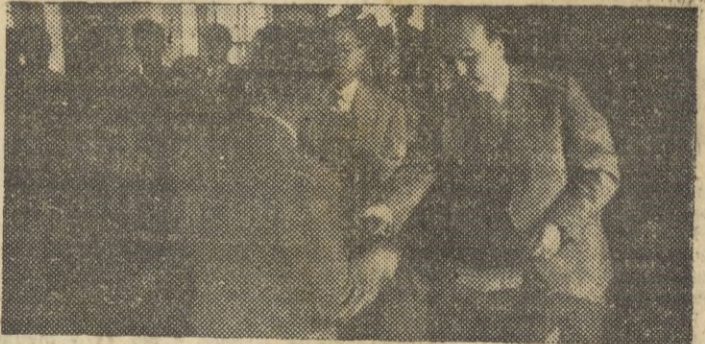
En la Caja Nacional de Previsión barcelonesa ha tenido lugar la entrega de premios al trabajo. En la fotografía, el Delegado del Trabajo haciendo entrega de los premios