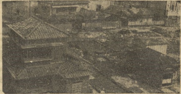
Para remediar en lo posible la carestía de viviendas en el Japón se están construyendo, infinidad de pequeñas viviendas en los solares devastados por lo bombardeos norteamericanos durante la guerra.

ciones se acepten por los dos tercios de los votos no podía someterse a votación. Añadió que esto era cuestión de práctica internacional y diplomática y citó la Conferencia de San Francisco por sexta vez en el día de hoy. Propuso que la Comisión acepte simplemente el punto de vista soviético. La nueva propuesta rusa causó sensación.