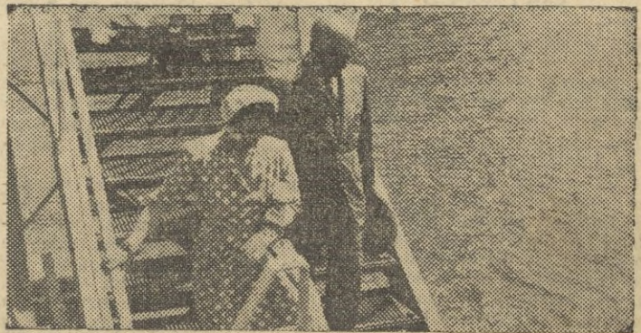
S. E. el Jefe del Estado y su esposa, están pasando unos días de vacaciones en San Sebastián. El fotógrafo ha recogido el instante en que desciende la escalera del Club Náutico para tomar la gasolina para dar sus paseos habituales por la bahía.