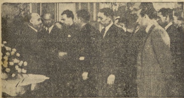
S. E. el Jefe del Estado estrecha la mano a los obreros que en representación de los trabajadores de Guipúzcoa acudieron al Palacio de Ayete para expresar al Caudillo su agradecimiento por las mejoras sociales realizadas últimamente por el Gobierno.