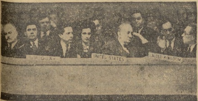
He aquí una fotografía de varios miembros de tres delegaciones de la ONU tomada durante una de sus sesiones