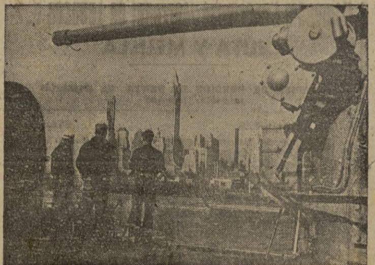
Tres marineros norteamericanos contemplan la ciudad de Nueva York, desde la cubierta de un crucero que regresa a la patria después de largo tiempo de ausencia.