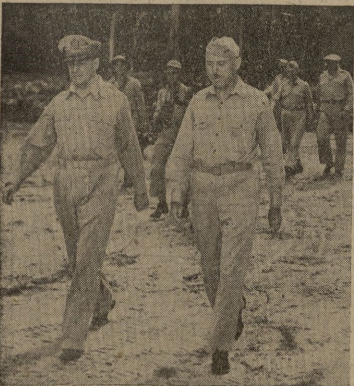
Gen. Arthur, como jefe del general MacArthur, visita un campamento de las fuerzas americanas que ocupan Tokio.