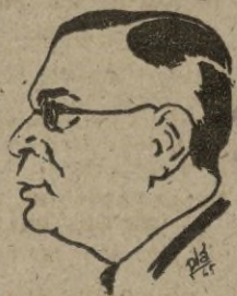
Van Mook, gobernador holandés en Java, cuyo rumor de que se había trasladado a Londres, ha sido desmentido.

Por dificultades de la política en Indonesia