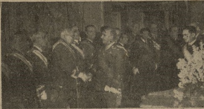
S. E. el Jefe del Estado, saludando a los Jefes de los Ejércitos de Tierra, Mar y Aire, durante la recepción celebrada en el Palacio del Pardo, con motivo de la Pascua Militar.