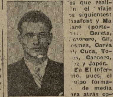
Japón su delantera ya que no se despla