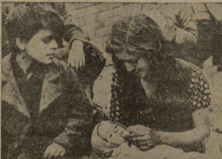
Una joven madre italiana da de comer a su hijo con los alimentos obtenidos de los aliados en una ciudad de la Italia Occidental