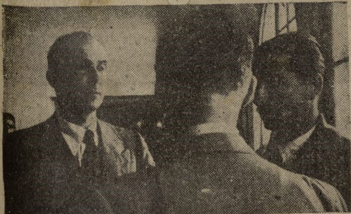
Humberto II de Italia ha llegado en avión a Barcelona. Momentos antes de emprender el vuelo hacia Lisboa conversa con los pilotos del avión. El rey exiliado marchó a Portugal para reunirse en Cintra con su esposa y sus hijos, en la residencia de la marquesa de Cadaval.