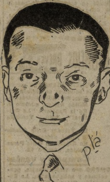
anunciando la candidatura de Georges Bidault. Le siguió Edouard Depreux, en (Pasa a la página 4)