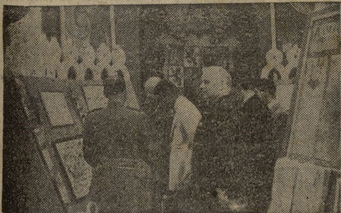
Madrid. — Bajo el patrocinio de la Dirección General de Marruecos y Colonias se ha celebrado una interesantísima exposición de Cartografía marroquí la cual ha sido visitadísima. El hijo del Jalifa visita la exposición acompañado por el Director general de Marruecos y Colonias.