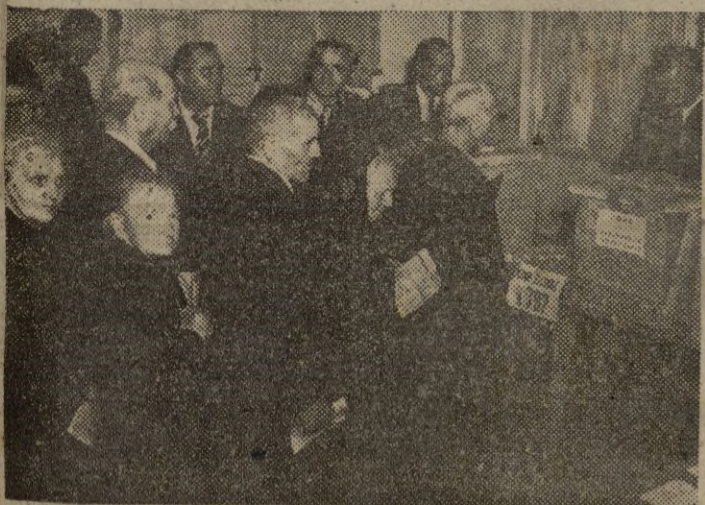
ITALIA.—Las elecciones de referendum celebradas últimamente en Italia y que han dado por resultado la proclamación de la República, transcurrieron sin mayores contratiempos. Nuestra foto recoge una impresión de los comicios, en el momento en que un grupo de ancianos está ejerciendo su derecho al sufragio.

golmetazo que le ha prodigado el poderoso organismo sindical el C. G. T. dominado por los comunistas.