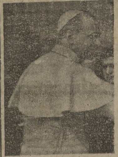
Ciudad del Vaticano, 2.—S. S. el Papa celebra hoy su 70 aniversario.

En la iglesia de San Ignacio se celebró una función religiosa