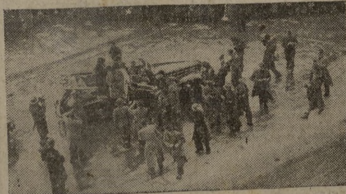
El mariscal Montgomery, terminadas sus vacaciones en Suiza, se despide del pueblo de Berna que lo aclama entusiastamente momentos antes de su partida para su Cuartel General en Alemania.