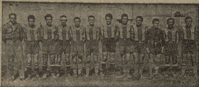
El "Ybarrola" que esta tarde en el C. Militar de Deportes se enfrenta a la J. Balompédica de Tetuán, en partido correspondiente a la última eliminatoria de Zona para el ascenso a primera categoría regional.

El ganador de esta eliminatoria se las verá con el campeón melillense