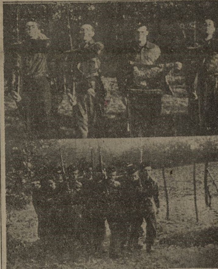
"Sexto. Protección constante prestada a las organizaciones de terroristas y guerrilleros rojos españoles que actúan desde los territorios franceses inmediatos a nuestra frontera y que encubren esas actividades con la pantalla de dedicarse a la explotación de los bosques pirenaicos". (Declaración del Gobierno español acerca de las relaciones franco-españolas de 1 de marzo de 1946.)

SE VAN ACLARANDO LOS CONCEPTOS Lo que Francia llama "no intervención en los asuntos de España"