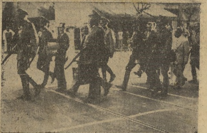
Peron y Tamborini depositan su voto. Las tropas argentinas cuidan del mantenimiento del orden durante las elecciones