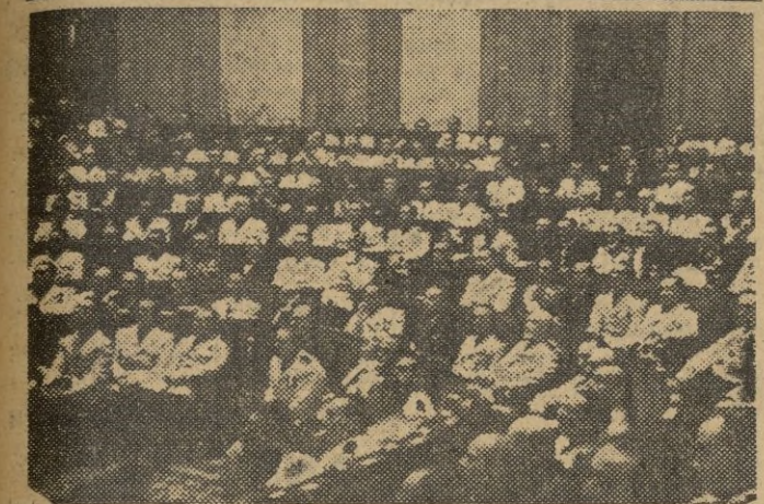
El Pleno de las Cortes españolas escucha la lección de política que desarrolló el Caudillo en la sesión de apertura del segundo perio- do de la Asamblea legislativa.