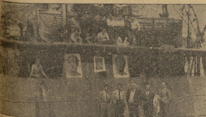
Un gesto simpático y harto elocuente fué el del capitán del barco carbonero inglés "Kalie", atracado en el puerto de Músel. Quiriendo asociarse al homenaje que la región rendía al Generalísimo engalanó la nave colocando varios grandes retratos de Su Excelencia como demostración de la simpatía que inspira a los buenos ingleses.