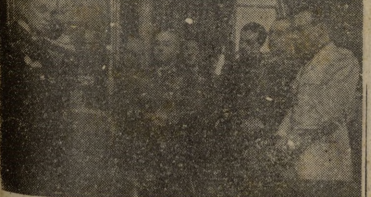
Jefe del Estado, durante un acto celebrado en su honor.