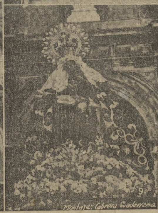
1.—Durante el Pontifical en el Santuario. 2.—Procesión de la Virgen de Africa antes de ser coronada. 3.—El Nuncio de S. S. durante la ceremonia. 4.—S. E. el Alto Comisario, jefe de Protocolo y Sr. alcalde durante el acto de la coronación. 5.—La Santísima Virgen, ya coronada. 6.—Padres Agustinos son portadores de la corona hacia el lugar de la coronación. 7.—El Nuncio de Su Santidad y S. E. el Alto Comisario en el momento de la Coronación. 8.—El Nuncio durante las oraciones, después de coronar a la Santísima Virgen. 9.—Vista de la Virgen coronada, luciendo el magnífico manto donado por Su Excelencia el Jefe del Estado.