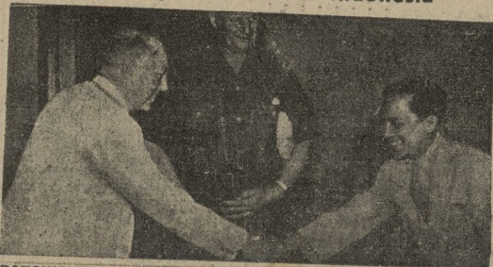
BATAVIA—En la presente fotografía se recoge el momento en que se estrechan las manos el presidente de la Comisión holandesa, profesor Willem Schermerhorn, ex-ministro de Estado, y Soetan Sjahrif, primer ministro de la República de Indonesia, poniendo fin a 14 meses de lucha interina.