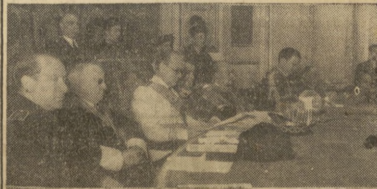
El ministro de Educación Nacional señor Ibáñez, acompañado del rector y otras personalidades, en la presidencia del acto de apertura del curso académico 1946-47 en la Universidad Central

Apertura del Curso Académico En la Universidad Central