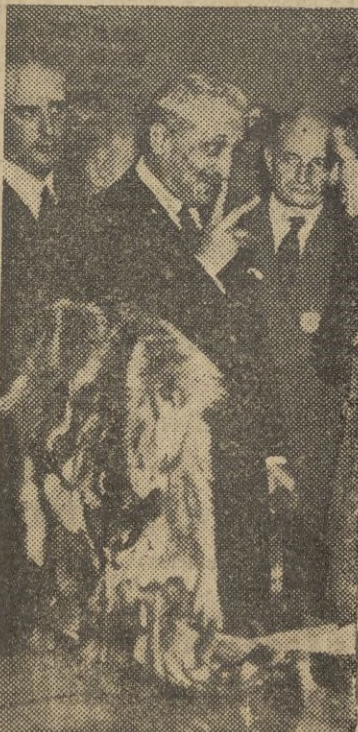
Milán. -- Por el presidente de la República, Enrico de Nicola, ha sido inaugurado en esta ciudad la XXVI Feria de Muestras de Italia.

En la fotografía, el Presidente de Nicola durante su visita inaugural.