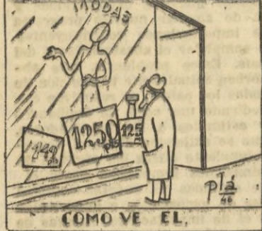
COMO VE EL