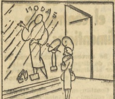
COMO VE ELLA