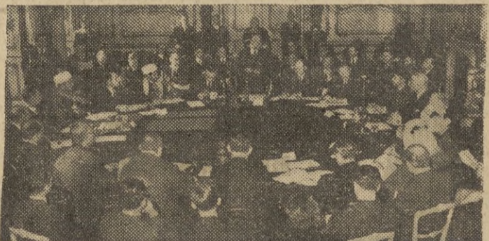
LONDRES.—Aspecto general de "Lancaster House" durante una de las sesiones de la Conferencia sobre Palestina que allí se celebra actualmente. En la fotografía: El primer ministro, Clement Attlee, se dirige a los delegados británicos y árabes