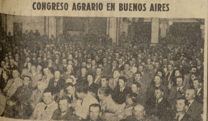
En Buenos Aires se ha celebrado un Congreso agrario en el que concurren más de 2.000 delegados. La fotografía reproduce un aspecto del salón «Los Embajadores» donde han tenido lugar las sesiones del Congreso.

París, 24. — Los cuatro grandes han decidido esta noche celebrar sus reuniones en Nueva York una vez que la Conferencia de la Paz aplazó sus sesiones el 15 de octubre. — EFE.