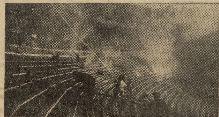
En la Plaza de Toros de Valencia se declaró el otro día un enorme incendio que fué tomando un gran incremento hasta convertir al coso taurino en un enorme brasero. Los bomberos trabajaban incansablemente para atajar el fuego. En la fotografía los vemos en un momento de su imprecisa labor.