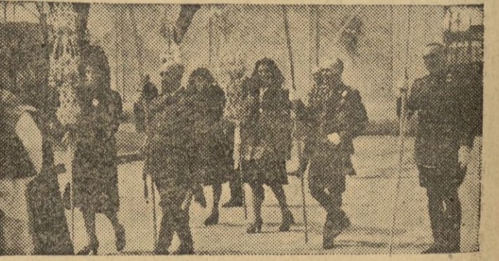
1.—Los restos del general Primo de Rivera llegan a Jerez. — Momento de ser bajado del tren el féretro. 2.—VIII aniversario de la Victoria.—S. E. el Jefe de Estado saluda a los miembros de su Gobierno. 3.—La esposa e hija del Caudillo contemplan el destile. 4.—Los carros de asalto pasan ante la tribuna del Generalísimo. 5.—Domingo de Ramos en El Pardo.—El Caudillo acompañado de su esposa e hija preside la procesión de las raimas