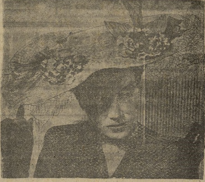
Los dibujantes y las casas de modas han decidido que este año los sombreros no sean tan austeros como durante la gue- rra. He aquí un modelo en el que se advierte la influencia de 1910: copa de paja, alegres adornos de flores y pájaros y el velo constituyen un conjunto que favorece a la cara.—(Caipo).