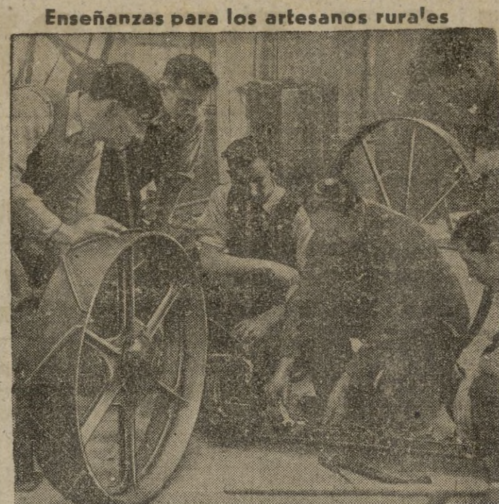
Enseñanzas para los artesanos rurales. A pesar de las cosas que se producen en serie hay una gran demanda de artesanos para las industrias rurales. En Inglaterra hay cursos de entrenamiento para los ex-combatientes de todos los oficios. En el grabado se ve a un instructor enseñando a los aprendices como deben ponerse los dientes a una máquina segadora.