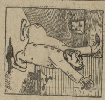
—¡Ubre, al fin libre! AIRES DE FAMILIA