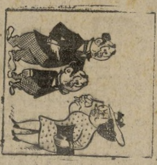
—Que parecidos son Vds. a los su hijo? —No, es mi padre! (De "O'Scario" de Lisboa) JEROGLIFICO núm. 2 Por G. MELO