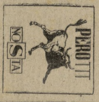
—Estivé con los conejos conforme con tu proposición? NO SÍ PEROTTI

Al hombre aquel le dejé olvidado en su rincón, después de escucharle con displicencia. Luego advertí que su descubrimiento no se apartaba de mi memoria; me obsesaba, me dominaba. —Claro es; la inferioridad—me decía a mí mismo—se produce porque los unos somos impermeables a la razón de los otros. Es un duelo esta vida, pugna constante entre dos egosimos igualmente respetable. Si nos hicieramos cargo de la forzada necesidad con que nuestro adversario actúa, al comprenderle y al comprendernos él a nosotros en nuestra necesidad forzada, nos identificáramos con él, y él con nuestra vivencia; por lo que sobrevendría la armoniosa fusión de los contrarios. Comprenderse; esta es la clave. Y para comprenderse, hay que susurrarse en el oído, en el que se nos enfrenta. (Continúa en la página siguiente)