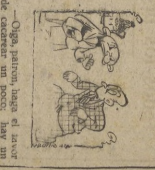
—Oiga, patron, haga el favor de cacarear un poco, hay un cliente que pide un hervor fresco. Servicio a la carta Por Padilla