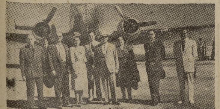
BARAJAS. — Una misión oficial española presidida por el embajador extraordinario, teniente general García Escamez, se dispone a emprender el vuelo para asistir en la República de Santo Domingo a la renovación del mandato presidencial del general Trujillo.