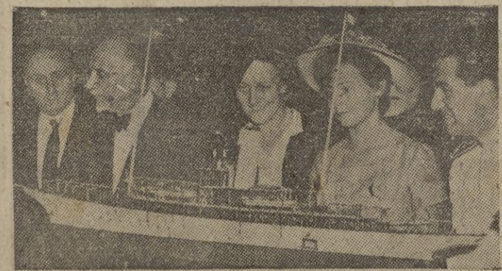
La esposa y la hija de Marconi contemplan el modelo del "Electra", barco en el que Guillermo Marconi realizó el primer experimento con un aparato de radio, ahora hace cincuenta años.