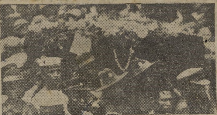
El ataúd del general Aung San, que recientemente fué asesinado en Birmania, con otros seis colegas, es conducido por miembros de las Fuerzas de Reserva de la Marina Real de Birmania. Con motivo del asesinato del general, se celebraron manifestaciones de protesta en Rangún