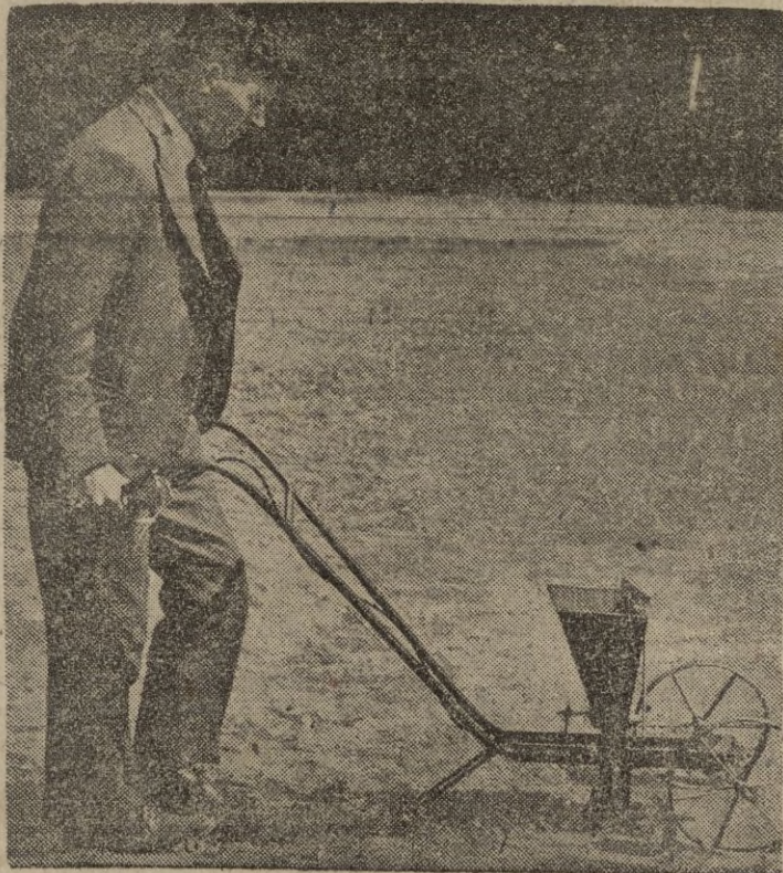
En una reciente demostración de la Real Sociedad de Horticultura se presentaron muchos nuevos aparatos mecánicos, como esta sembradora "Sexion" con la que se ahorra una considerable cantidad de tiempo y esfuerzo. — (Calpe).