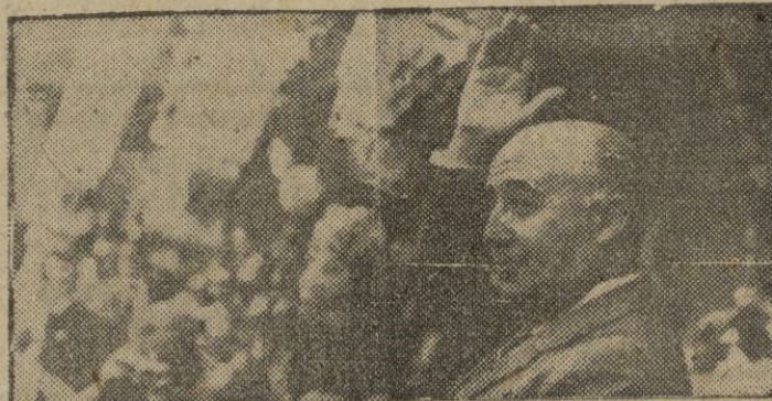
SAN SEBASTIAN.—S. E. el Jefe del Estado, acompañado de su esposa e hija asiste a la primera corrida de feria. El Caudillo saluda desde su palco al público que le aclama