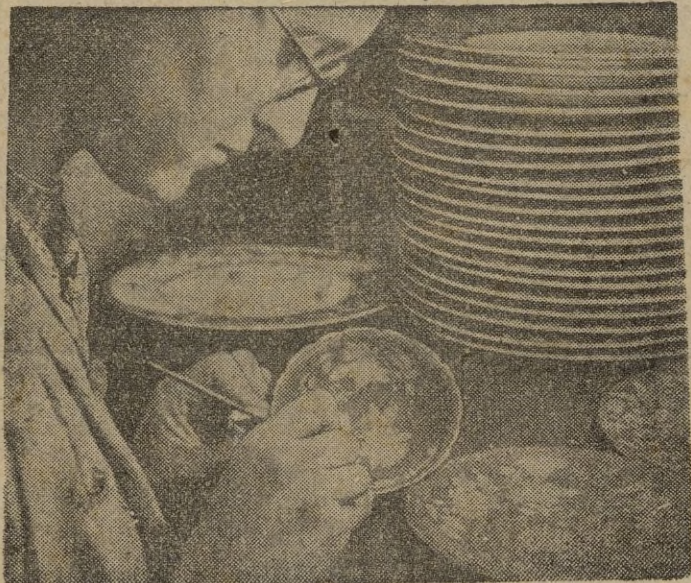
Desde comienzo del siglo XVIII, los modeladores de barro británicos en loza, barro y porcelana, han hecho una magnífica labor por su acabado y colorido